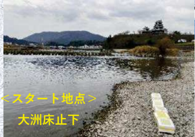
←スタート地点→ 大洲床止下

1月5日10時に大洲床止から模擬ごみを投入し、1時間ごとに位置を追跡しています。