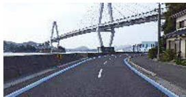
③ 生名島・佐島・弓削島 3島めぐりコース