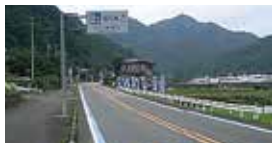
① 宇和島・四万十だんだん街道