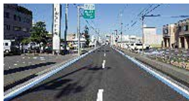
② 今治・西条ゆうゆう輪道