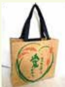
愛媛SDGsライスパッグ (株CPI)