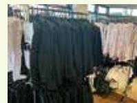
NPO法人ライフサポートアゴラ