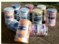
今治のホコリ (西染工業)