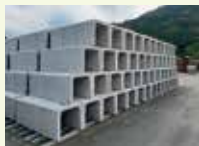
KLCコンクリート (株キクノ)