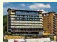
道後温泉 ホテル古湧園 遥