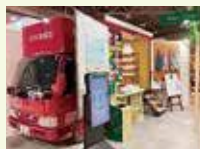
タオル美術館グループ 一広株