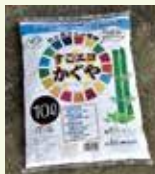
かぐや (長崎工業株)