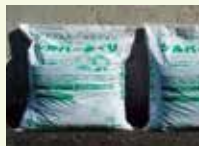
シルバーあぐり (公社)新居浜市シルバー人材センター