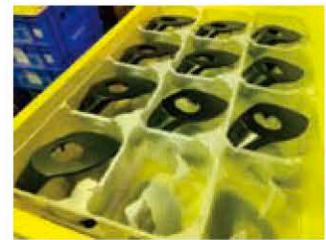
③製品に成型して出荷