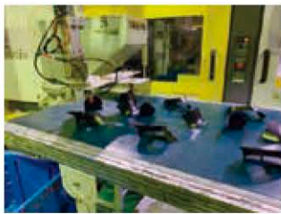
①完成品と不良品を選別して、不良品を自動回収