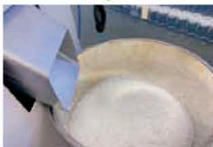
混合しやすいペレット形状に再生

《捻り圧縮工法》 フィルムを捻ることで、 円柱断面で密度の高い ペレットの形成を実現