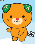
愛媛県イメージアップキャラクター みぎやん