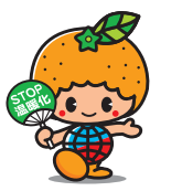
愛媛県地球温暖化防止キャラクター ストッピャー