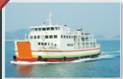
旅客船:「第2ななしま」