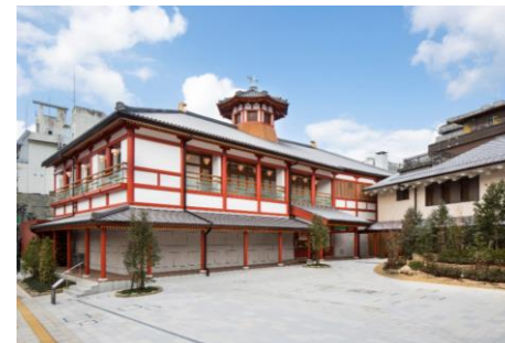
道後温泉別館 飛鳥乃湯泉

★ 協和酒造株式会社 酒蔵カフェはつゆき イートドリンク50円引き サイクルオアシス