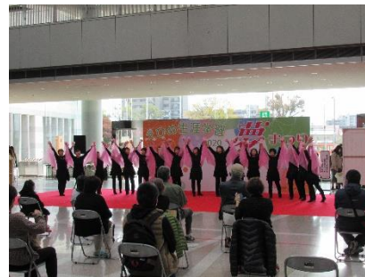
レクリエーションダンス