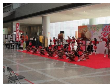
「久米小学校水軍太鼓クラブ」による水軍太鼓演奏