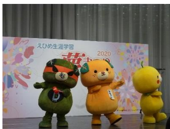
みきゃんたちが「ハイポーズ」