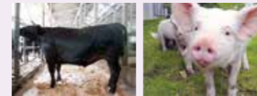
愛媛あかね和牛 愛媛甘とろ豚