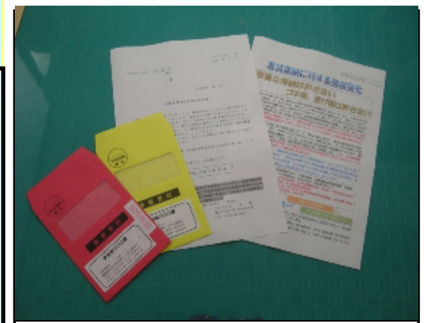
移管催告の送付文書、赤・黄色封筒等

・取り扱う債権を段階的に拡大するのではなく、すべての債権を統一した基準で徴収強化を図るようにした。また、一部の債権は、費用対効果を考え、民間委託を実施するなど民間の徴収ノウハウを活用した徴収強化を図るようにした。