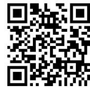
愛媛県職員採用情報 ホームページはこちら