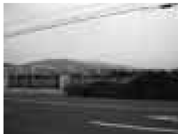
四国乳業重信 工場用地

(ハ)さらに、処分対象土地・建物としてターゲットを決めて処分をしていくものには、県有財産管理・処分委員会において「将来の公用・公共用として管理保全するのが適当」と判断したものは除かれているが-----前述のフローの(b)、結果として志津川県有地のように15,224.64㎡の土地が10年以上に渡って有効利用されずに残ってしまったという事態になっている例があった。遊休県有地については、毎年、その時点での将来の利用計画を見直し、検討し、長い期間遊休が続くものについては、その実現可能性を見直し、素早い対応をする必要がある。(意見)