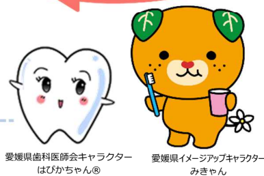
愛媛県歯科医師会キャラクター はびかちゃん®