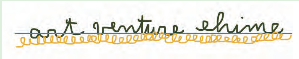
▲ロゴデザイン:日比野克彦