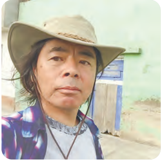
日比野克彦さん 岐阜市生まれ。東京藝術大学美術学部デザイン科卒。2022年4月1日学長就任。

アートは冒険だ! まだ見ぬ先を見に行こう! ひとりひとりの形の山がある。 ひとりひとりの流れの川や海がある。 となりの山にのぼってみよう。 麓の川で舟を作ってみよう。 その先に見えてきた海へ! 人と会えば世界は広がる。 アートが人を広げてくれる。 さあ! アートベンチャーに出かけよう!