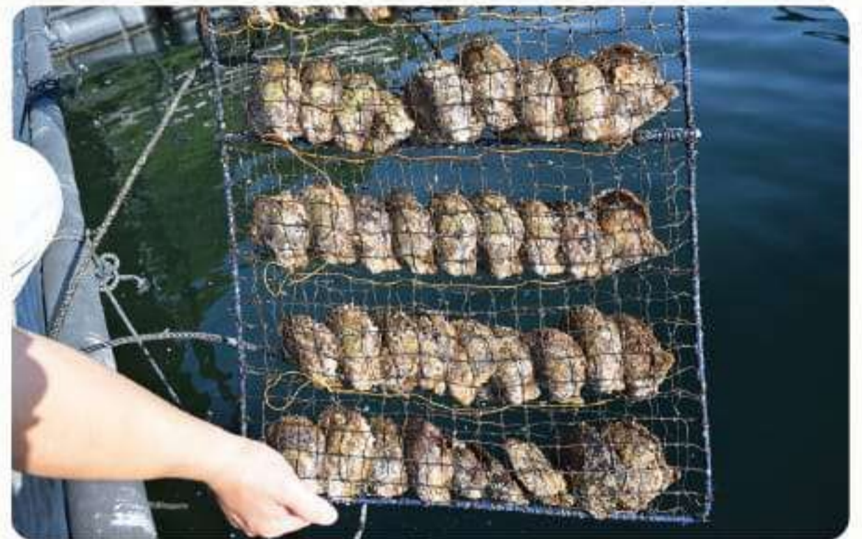
▲ 宇和島水産高等学校でも真珠を養殖

こうして、恵まれた自然環境と先人の知恵を活かしながら発展してきた宇和海を中心とする愛媛県の真珠養殖は、令和2年の農林水産統計では12年連続生産量日本一、真珠母貝生産量は50年連続で日本一を誇っています。近年は、ウイルスによるアコヤガイの稚貝の大量死などにより生産量への影響も生じていますが、自然の恵みを凝縮した「真珠」養殖は、産業だけでなく、私たちの暮らしを彩るものとして、守り伝えていくことが必要になっています。