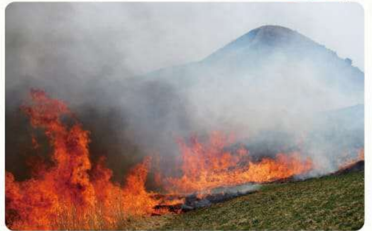
▲ 山焼きは約半日かけて行う

山焼きは3月または4月の土曜日夜に三好市側で始まり、翌日昼に新宮側で行います。最初は頂上に着火、左右の稜線まで火が下りてきたら東西につなげ、山頂からじわりじわりと自然に燃え下りてくるようにするのがきれいに焼くコツ。消防団以外の参加者は地元産スギを利用した火消しぼうき「杉しば」を活用します。山焼きは約20ヘクタールにも及び、燃焼時間は約4時間かかります。