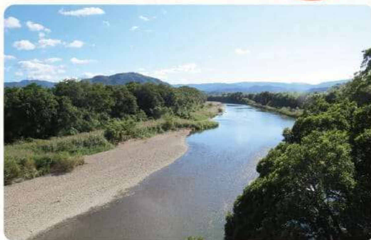
▲ 源流から河口までの直線距離は 18km

肱川流域の治水対策は長年にわたって行われていますが、数十年に一度と言われる規模の災害には対応することができず、平成30年（2018年）7月の「西