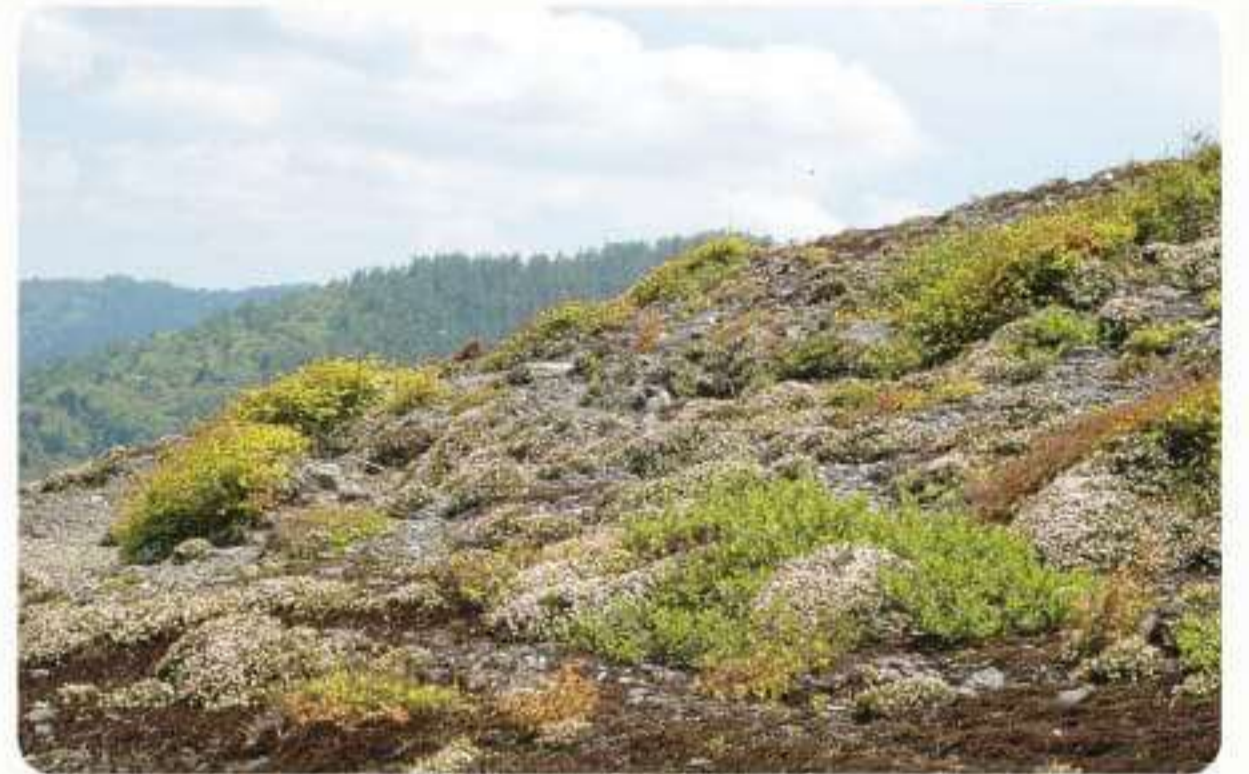
▲厳しい条件のもと可憐な花を咲かせるツガザクラ

別子銅山の標高約1,300mの銅山峰（どうざんみね）に生育している『ツガザクラ』は5月中旬～下旬に花を咲かせる高山植物で、「銅山峰のツガザクラ群落」として国の天然記念物にも指定されています。名前の由来は花の先の薄い桃色が桜に、葉っぱが針葉樹の「ツガ」に似ているからです。主に日本アルプスなどの標高約2,500mの高山帯に自生していますが、低山である銅山峰は国内で最も南に位置する生育地の一つです。北極圏周辺に起源を持ち、約80万年前の氷河期に南下して日本列島に到達しました。平地でも生育していたツガザクラは暖かいところが苦手なため、氷河期の終わりとともに絶滅していく他の植物をよそに、寒い山の上という環境を見つけることで生き残ることができたのです。