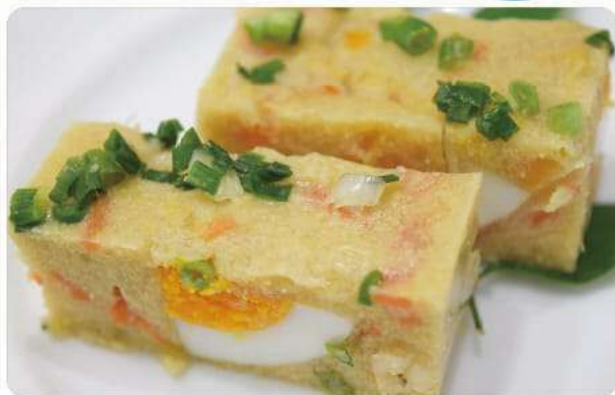
▲ 家庭で作るいぎす豆腐の具材はお好みで

いぎす豆腐は、各家庭で入れる材料が異なるため、それぞれ少しずつ味も見た目も異なっています。しかし、「おふくろの味」とも言える伝統的な料理は、いぎすの漁獲量の減少により価格も上がっており、最近では嗜好の変化とも相まって家庭