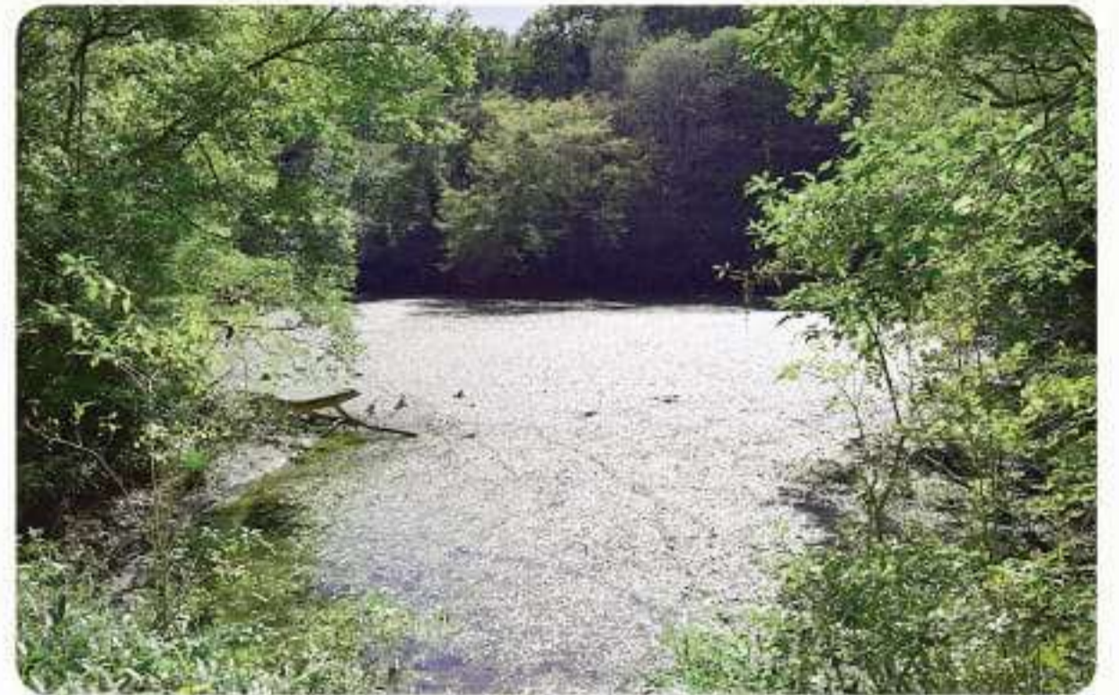
▲ 水面を覆い尽くすオヒルムシロ

平成14年(2002年)の調査によると、池には「オヒルムシロ」をはじめとする、16種の植物が確認されています。きれいな水がないと育たない、西日本では希少な「ジュンサイ」も自生しています。また、水生動物では、ドジョウ、ヒル、トンボ、カメムシなど、24種が確認されており、マッチ棒の頭ほどの二枚貝である希少種の「ドブシジミ」も生息しています。春はウグイスやキツツキ、冬はエサのドジョウを求めてカモもやってきます。イノシシが体に付着した虫や汚れを落とすために泥浴びをする「ぬた場」もあり、周辺は山栗、山芋、葛(クズ)の根、サワガニなどのエサも豊富です。そのような自然の中で食べたり食べられたりという多様な「食物連鎖」が行われているのは、手つかずの自然が残っているからです。