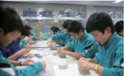
▲県立三島高校との交流