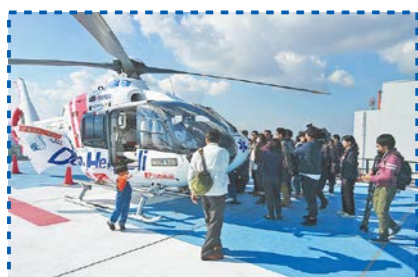
ドクターヘリ見学会

県民の皆さんにドクターヘリのご理解と救急医療の知識を深めてもらうことを目的に、県内各地でドクターヘリの運用訓練などを実施しています。