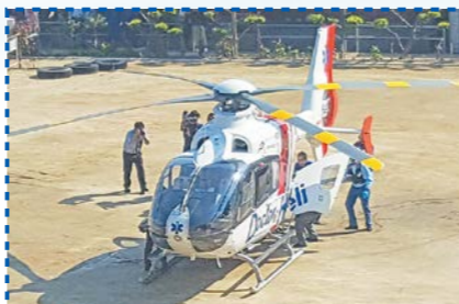
ドクターヘリ運用訓練・普及啓発(西予市)