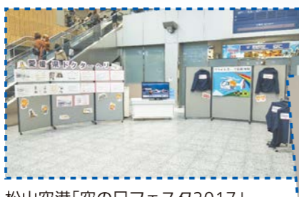
松山空港「空の日フェスタ2017」ドクターヘリPRイベント