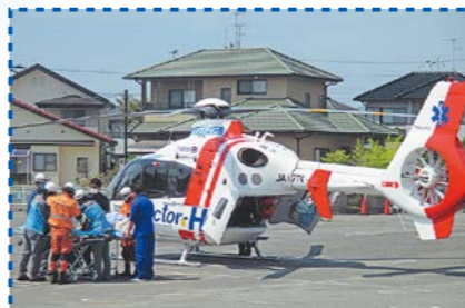
「救急の日」イベント(東温市)