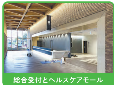
総合受付とヘルスケアモール