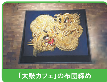
「太鼓カフェ」の布団締め