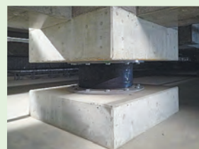
地下で新診療棟を支える免震構造

屋上ヘリポートを設置し、従来の地上ヘリポートと同時運用。新診療棟は地震の力が直接伝わらない免震構造で、東日本大震災クラスの地震でも病院機能が損なわれない設計です。