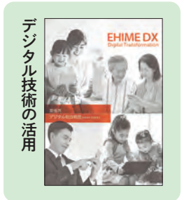
デジタル技術の活用