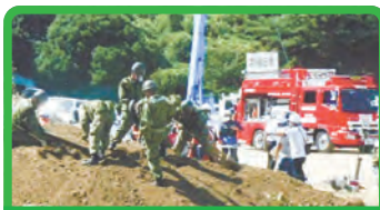
西日本豪雨災害からの復興と防災・減災対策