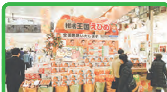
地域経済の活性化