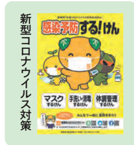
新型コロナウイルス対策