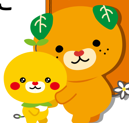
オレンジリボンには、子どもに対する虐待を防止するというメッセージが込められているんですよ。