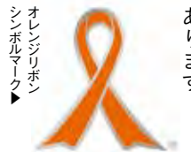
オレンジリボン シンボルマーク

なぜ、子どもに体罰等をしてしまう大人がいるのでしょうか。言うことを聞いてくれない、接し方が分からない…大人も不安な心があり、大変さを一人で抱え込んでしまっていることが考えられます。だからといって、子どもに体罰等を与えることは許されません。 子育てで困ったことがあっても、一人で悩まないで。児童相談所や市町の子育て支援窓口がサポートします。 地域で育児を支える社会に児童虐待はみんな防げよう 児童虐待は社会全体で解決すべき問題です。「近所のあの子、最近おかしい」と思ったら、児童相談所虐待対応ダイヤル「189」へすぐお電話を。あなたの電話で守れる子どもの命があります。