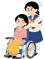
相談窓口は 愛媛県HP に掲載！

周囲が気づいて声をかけ、孤立させない社会を目指す 「ヤングケアラー」についてご存知ですか？ 本来、大人が担うと想定されている家事や家族の世話などを日常的に行っている18才未満の子どもです。家族の手伝いや手助けをするのは、ごく普通のことと思うかもしれませんが、しかしヤングケアラーは勉強に励んだり、友人と語り合ったりするなどの子どもとしての時間と引き換えに、家事や家族の世話をしていることがあります。 まずは周囲の大人が気づき、手を差し伸べる必要があります。お気づきの点がありましたら、ヤングケアラーに関する相談窓口へご相談ください。