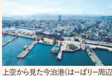
上空から見た今治港(はーぱりー周辺)