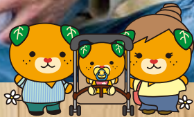
愛媛県イメージアップキャラクター みきやん