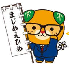
【愛媛県イメージアップ キャラクターみきゃん】