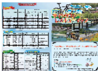
レスキュー マップ

エントリーサイトやフェイスブック等を活用し、予土県境地域のサイクリングや観光に関する情報等を広く発信した。