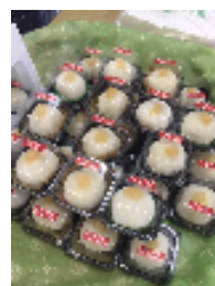
補給食 (しょうが大福)