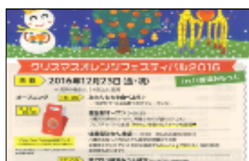
〔クリスマスオレンジフェスティバルのチラシ〕

愛顔のみかんプロジェクト(H25~27 局予算)を踏まえ、ハートみかん制作(川上・真穴共撰等)のほか、民間等と連携したイベント(クリスマスオレンジフェスティバル(H28. 12. 23)等)や港・市町庁舎等で、みかんやカボスの両県柑橘のPR等を実施