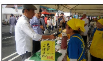
〔加・ネ・デル・ナゴ (10/9)〕