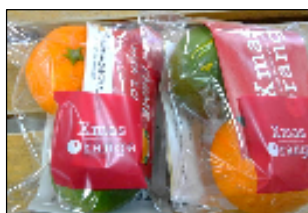
〔みかんとカボスのコラボ〕