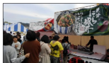
〔八幡浜産業まつり (11/13)〕