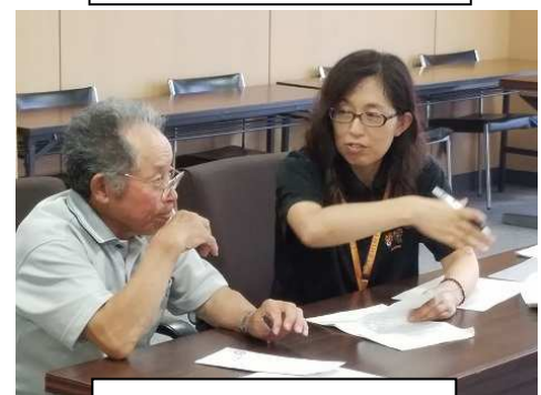
認定農業者経営相談会