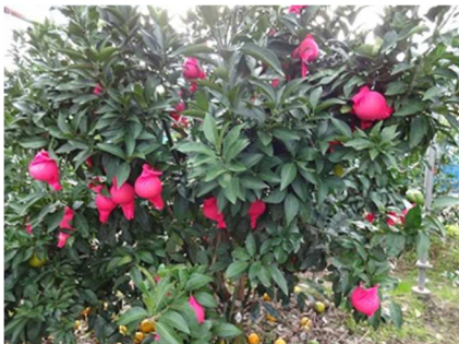
日焼け果防止のための現地実証