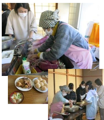
松山市の庄地区で、親子を対象に、地元野菜の庄大根の紹介や庄大根を使った豚汁等を作りました