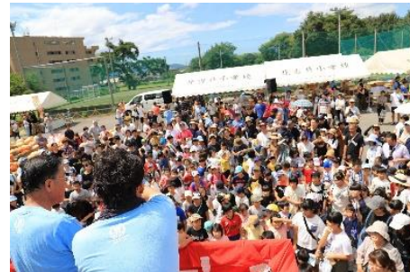
どてかぼちゃカーニバル(R元年)