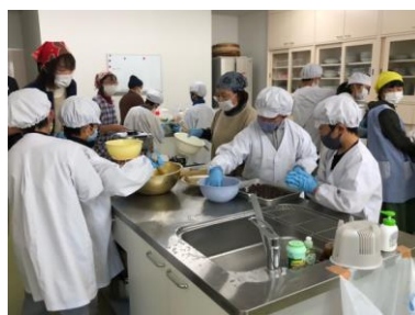
小学生とふるさと料理づくり