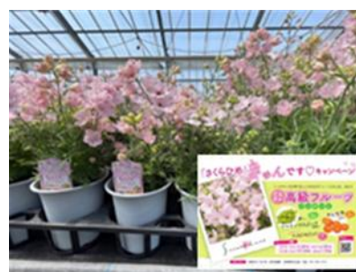
キャンペーンを利用した消費者ニーズ調査の実施