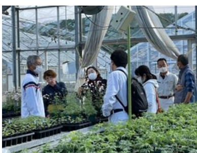
ハウスで情報交換を行う鉢物栽培セミナー参加者