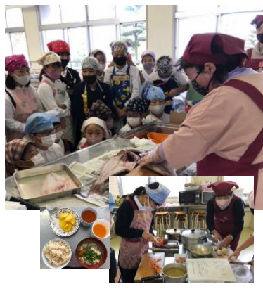
伊予市の北山崎小学校では、鯛のさばき方を見学した後、鯛めし、芋炊きを作りました