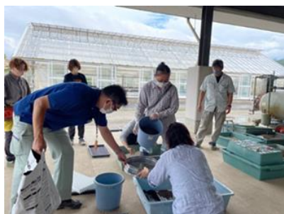
新規生産者対象の自家育苗講習会