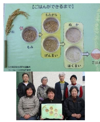
町協議会では、稲穂からご飯をテーマにしたディスプレイを作成し、町内の全小学校、幼稚園に配布しました。