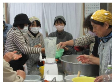
こんにゃくの技術伝承