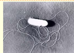
リステリアの顕微鏡写真（約0.5×1μm）

リステリア（リステリア・モノサイトゲネス）は、動物の腸管内や環境中に広く分布している細菌で、食品を介して感染する食中毒菌です。多くの食中毒菌が増殖できないような低温や高い塩分濃度の食品でも増殖します。