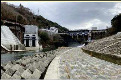
スタート地点：鹿野川ダム直下

愛媛県南予地方局大洲土木事務所管内図（承認番号平29情使,第689号、第805号承認番号平29情復,第805号）加筆