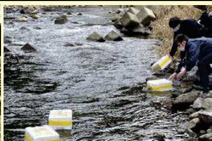
模擬ごみ投入：1月26日12時