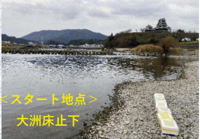
スタート地点 大洲床止下

1月5日10時に大洲床止から模擬ごみを投入し、1時間ごとに位置を追跡しています。