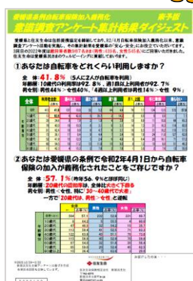
アンケートおよび集計結果