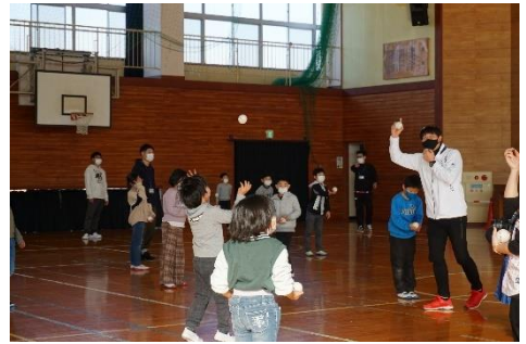
夢へのキャッチボール開催の様子

令和5年1月10日に、西予市の「社会福祉法人三瓶福祉会コスモス館すこやか児童クラブ」において、「やってみよう！マジック」(Zoomを利用したオンライン開催)、1月11日に東温市の「川上放課後わくわく教室」において「夢へのキャッチボール」(講師訪問による対面開催、講師は元ヤクルトスワローズのエース投手で、野球解説者の川崎憲次郎さん)というプログラムを実施しました。