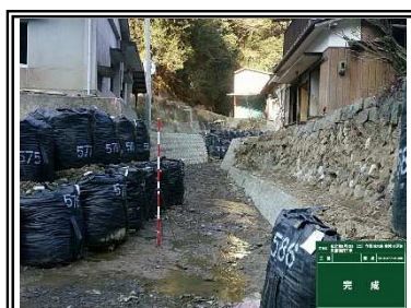
応急復旧（河道確保）完了