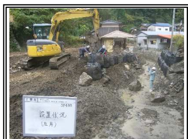
応急復旧（河道確保）状況