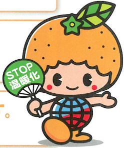
愛媛県地球温暖化防止キャラクター ストッピー

すぐに対策を実行できるように、「具体的にどうすればいいの?」といった質問にお答えします。