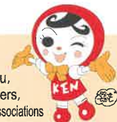
Mga Imago characters ng Karapatang Pantao Jin KEN Ayumi-chan

Ehime Prefecture, Matsuyama District Legal Affairs Bureau, Ehime Federation of Human Rights Volunteers, Ehime Human Rights Awareness-raising Activities Network Associations