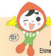
Mga Imago characters ng Karapatang Pantao Jin KEN Mamoru-kun

Huwag mong sarilinin ang iyong problema. Mangyaring sumanguni sa amin.