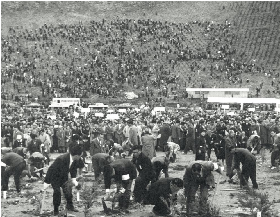
■一般参加者による植樹