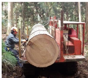
優良材生産を掲げる「久万林業」