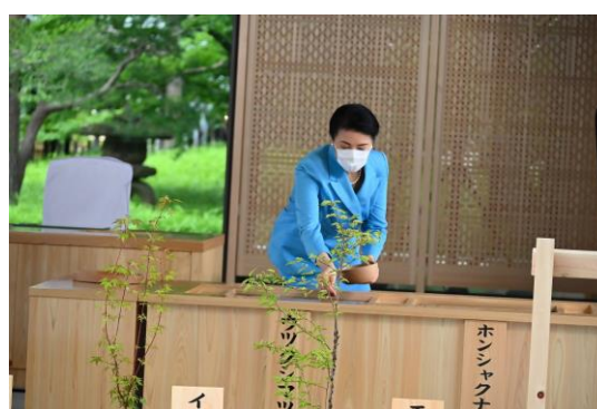
■両陛下お手植え・お手播き（第72回全国植樹祭 [滋賀県]）