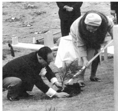
■天皇・皇后両陛下によるお手植え 天皇陛下ご提案の「森」の字型にスギ3本をお手植えされる両陛下