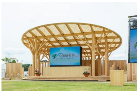
■県産材を活用したお野立所 (第72回全国植樹祭 [滋賀県])