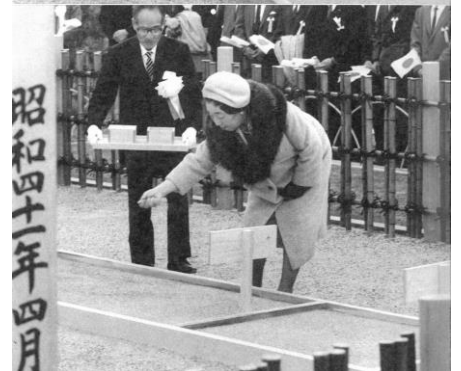
■天皇・皇后両陛下によるお手播き(会場：旧県立果樹試験場(現 愛媛県研修所)) スギ・ヒノキ・クロマツ・アカマツの種子をお手播きになる両陛下