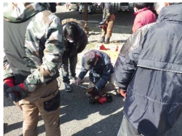
(事業2：研修の実施状況)