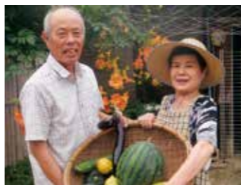
「新谷じいちゃんばあちゃん」