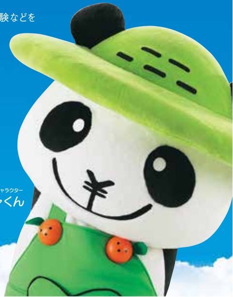
JAバンクえひめキャラクター ぱんじゃくん

JAバンクえひめでは、食と農業に対する学習や農業体験などを はじめとした様々なCSR活動を通じて、 自然と調和・共生できる循環型社会の実現をめざし、 地域の皆様の豊かな未来の実現に取り組んでいます。