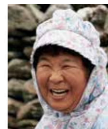
「元気なお婆ちゃん」