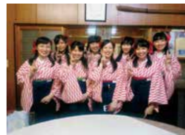
「愛姫の笑顔でお国自慢」