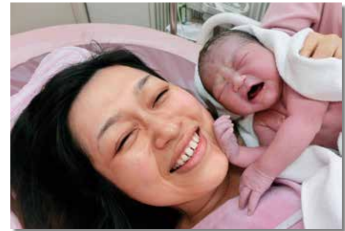
「がんばったね！ ～わたしがママよ～」