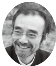
新井 満 (審査委員長)

1983年愛媛県松山市生まれ。 2001年、松山東高等学校時代に第四回俳句甲子園にて団体優勝、「カンバスの余白八月十五日」が最優秀句に選ばれる。 2004年、第一回芝不器男俳句新人賞坪内稔典奨励賞を受賞。 2006年から、6年間、NHK『俳句王国』司会を担当。 現在、明治大学兼任講師。