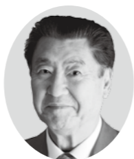
白川 義員 (特別審査員)

1946年新潟県生まれ。作家、作詞作曲家、写真家など多方面で活躍。1988年、『尋ね人の時間』で第99回芥川賞受賞。 2005年、『この街で』（作詞：新井満、作曲：新井満、三宮麻由子）を制作。 2007年、『千の風になって』で第49回日本レコード大賞作曲賞を受賞。 2014年、正岡子規の俳句にメロディをつけ、松山市民の愛唱歌「春や昔」を制作。子どもから大人まで松山市民に愛される曲となる。