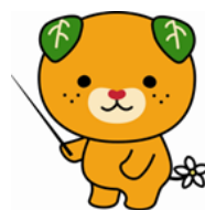
愛媛県イメージアップキャラクター「みきゃん」

話をよく聞いて、一緒に考えてくれるゲートキーパーがおいたら、悩んでいる人の孤立を防いで、安心を与えることができるんよ。