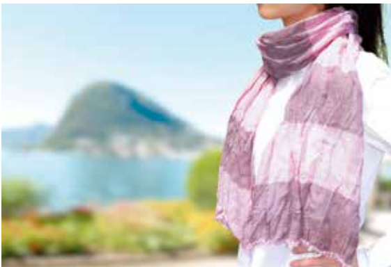
瀬戸内の潮風のようなガーゼのやわらかな肌触りが楽しめる