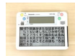
意思伝達装置 1つの入力スイッチだけで、 文章の表示・読み上げ等が できる。