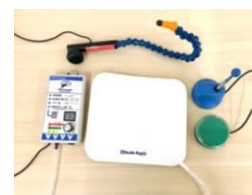
スイッチ各種 頬や指先等の身体の一部を 使って、わずかな力で機器 操作ができる。