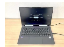
視線入力装置 目の動きだけでパソコン 操作ができる。