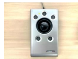
ポインティングデバイス 手のふるえ等があっても 使えるトラックボール等。