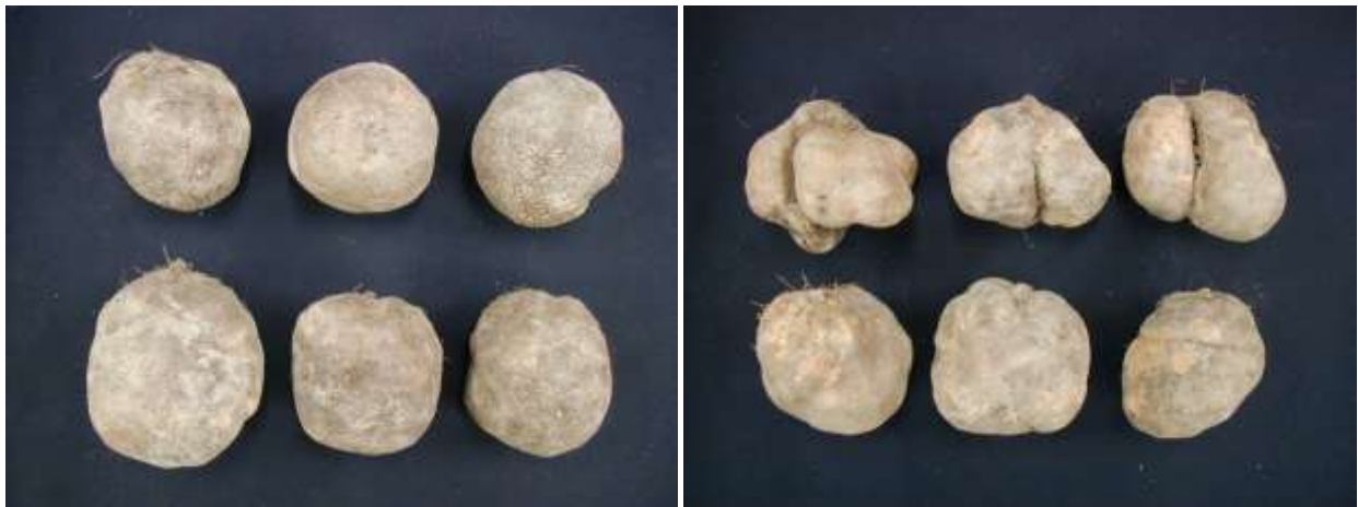
写真2 ‘やまじ王’（左）と在来種（右）に芋部 【13ページ】