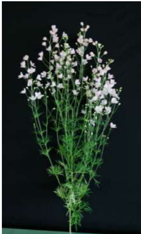
図1 元切り 【53 ページ】