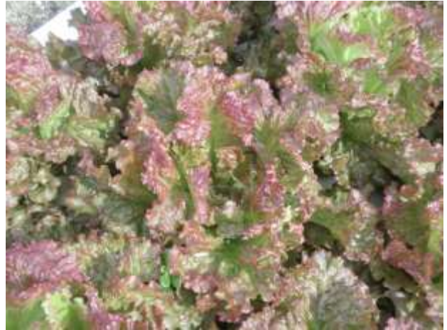
写真3 リーフレタスのチップバーン【4ページ】