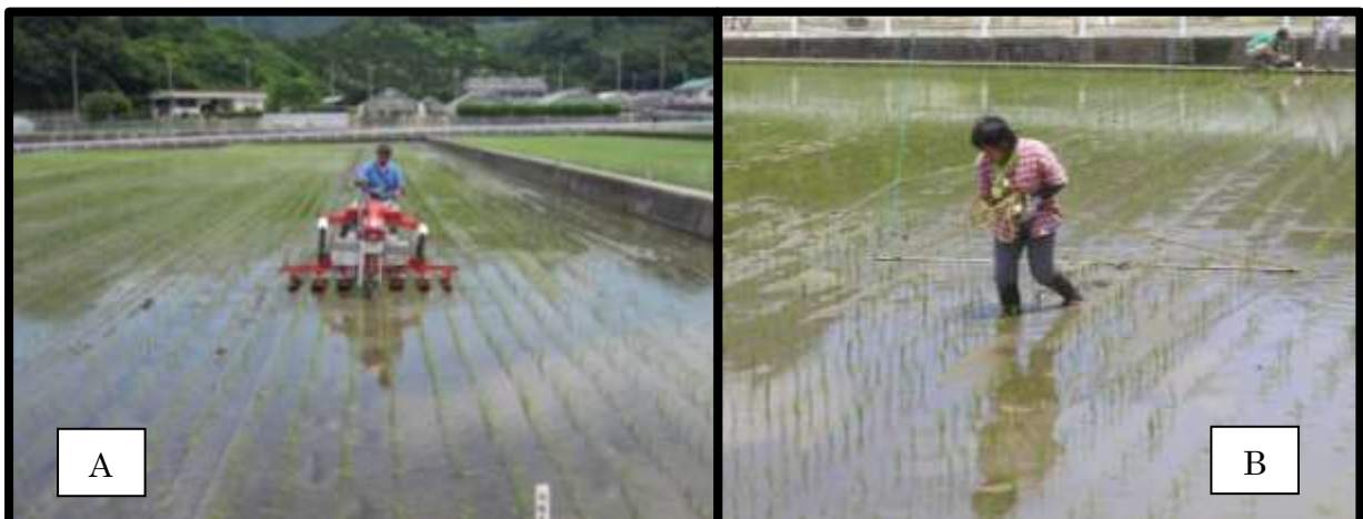
写真1 機械除草作業およびチェーン除草作業の様子【38ページ】