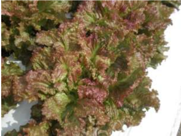
写真2 リーフレタスの抽台【4ページ】