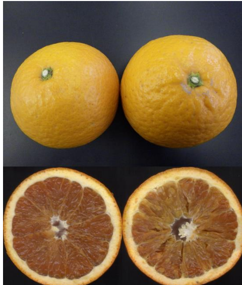
図1 中晩柑類‘清見’の外観と内観 左：正常果 右：寒害果 【2ページ】