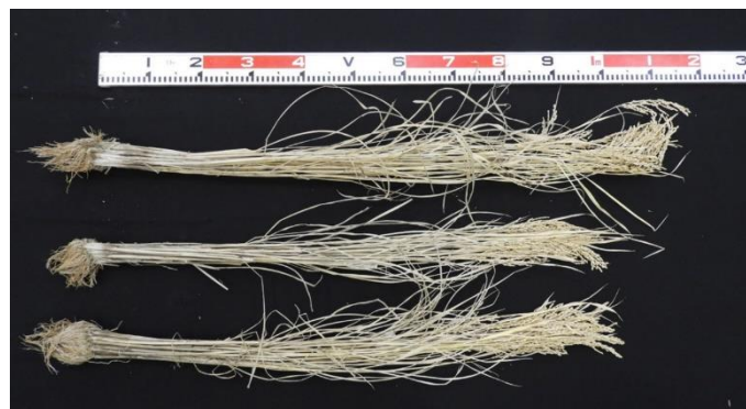
図7 ‘媛育83号’の稲株【32ページ】 (上から媛育83号, 媛育71号, ヒノヒカリ)