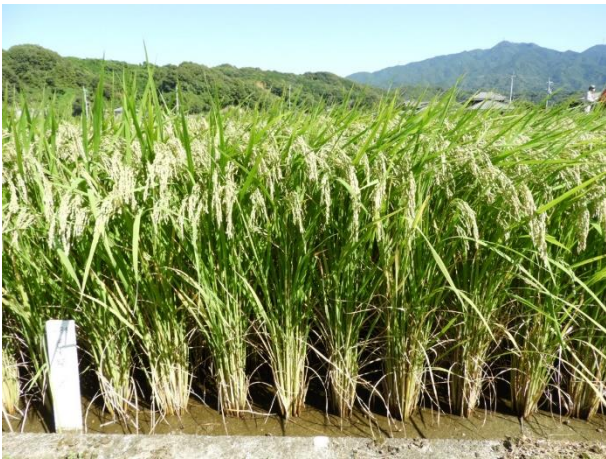
図8 ‘媛育83号’の草姿（乳熟期）【32ページ】