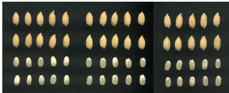
図10 ‘媛育83号’の粳と玄米（左から、媛育83号、媛育71号、ヒノヒカリ）【34ページ】