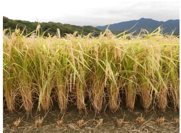
図9 ‘媛育83号’の草姿（成熟期）【32ページ】