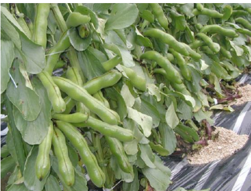
‘愛のそら’（左：収穫前、右：莢）