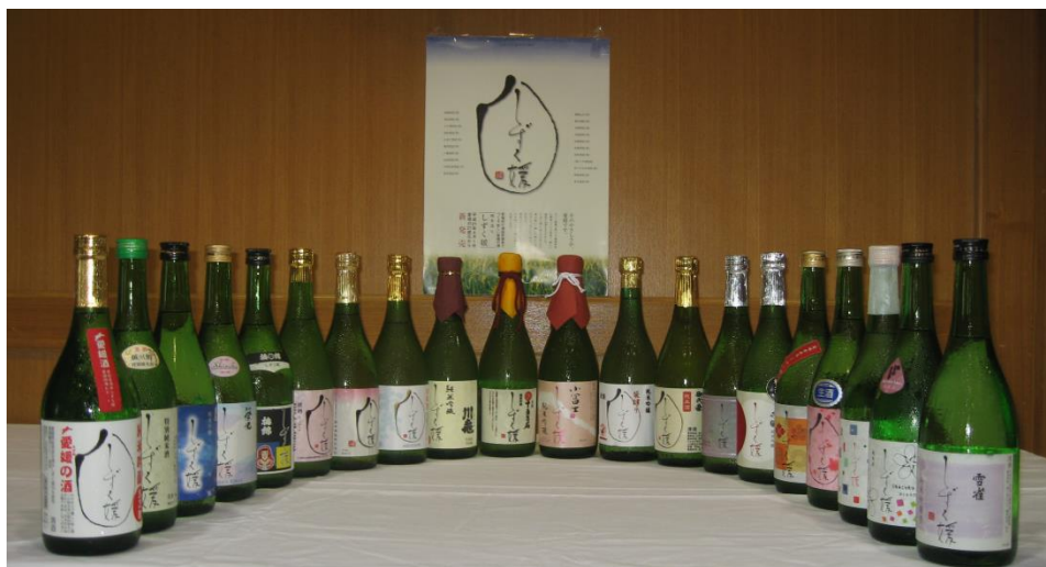
県下 16 社の酒造メーカーから販売されている共通銘柄「しずく媛」