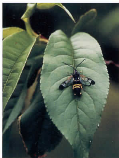
コスカシバの成虫