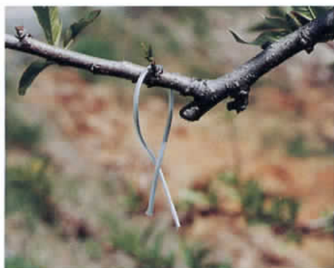
ディスプレイの設置状況