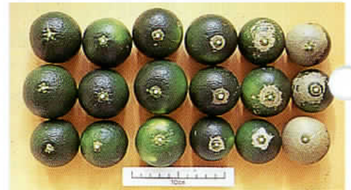
写真2 程度別被害果実