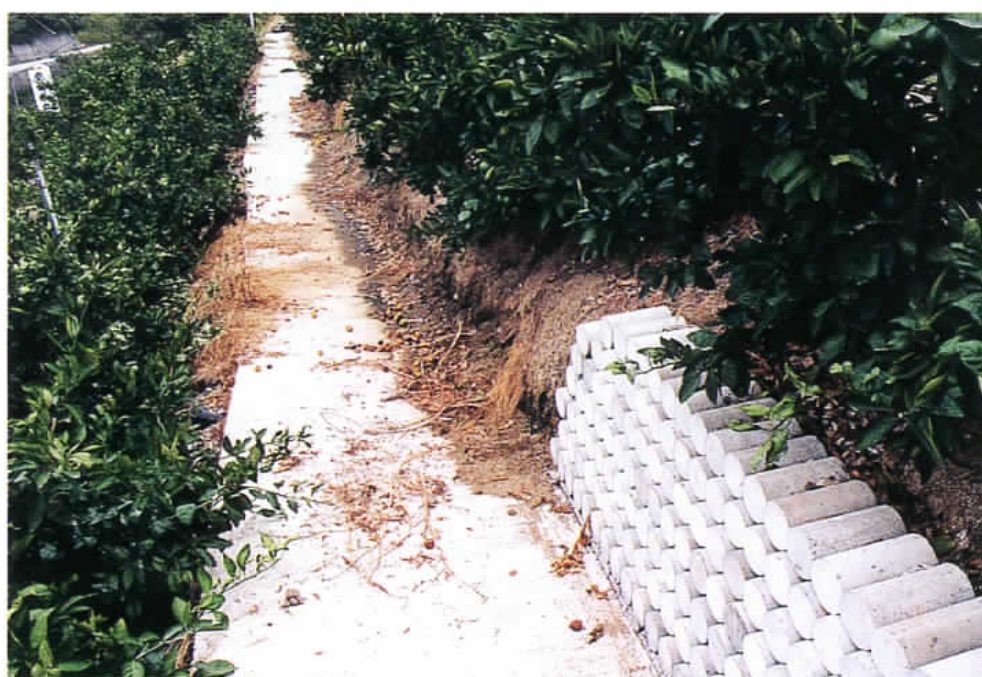
写真1 作業道設置と土壌流亡対策

注) コンクリート壁、テストピース積上ともに高さ70cm、設置1年後の流土量、破損程度 盛土面は幅1.2m作業道設置及びコンクリート舗装費用含む 古タイヤ、テストピースは無償