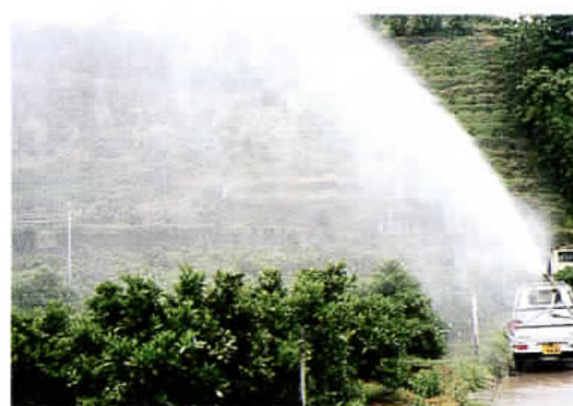
スプリンクラーSSでの散布状況