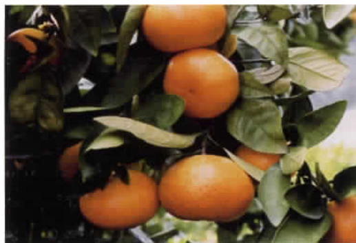
写真1 ひめのかの結実状況

果実は120g程度で、果形は扁平、玉揃いは良い。浮皮の発生は大津4号より少ない。成熟期は12月中～下旬で、糖度は13度程度、